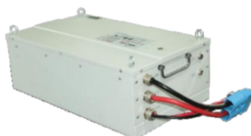
型号: LFP48-4800-01 尺寸: 614*346*202mm