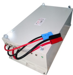
型号: LFP48-19776-01 尺寸: 970*520*300mm