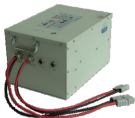
型号: LFP48-1440-01 尺寸: 380*235*214mm