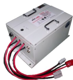
型号: LFP48-2400-02 尺寸: 360*255*193mm