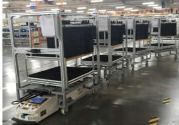
物流搬运机器人/AGV应用