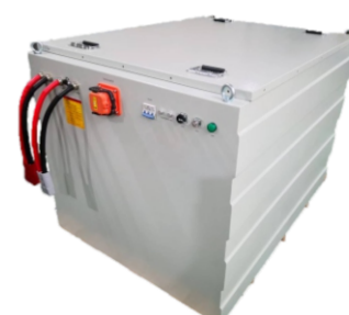
型号: LFP500-150000-01 尺寸: 1500*1100*1050mm