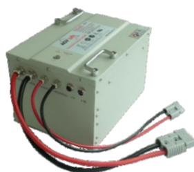
型号: LFP24-1536-01 尺寸: 333*241*214mm