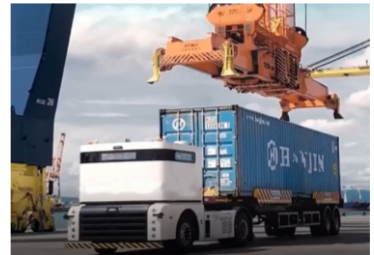
特种港口搬运车应用