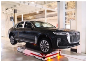
汽车工厂机器人/AGV应用