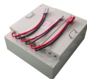
型号: LFP48-7680-01 尺寸: 600*560*255mm