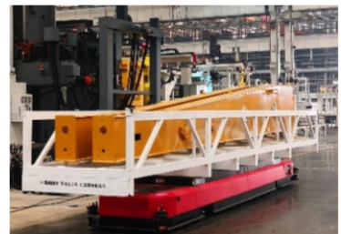
智能工厂重载机器人/AGV应用