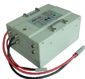
型号: LFP24-1024-01 尺寸: 315*237*165mm