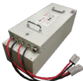
型号: LFP48-2880-01 尺寸: 567*241*226mm