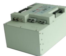
型号: LFP24-1536-02 尺寸: 325*237*187mm