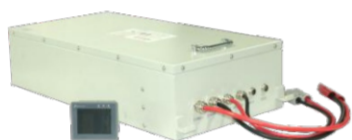
型号: LFP48-4800-02 尺寸: 720*210*260mm